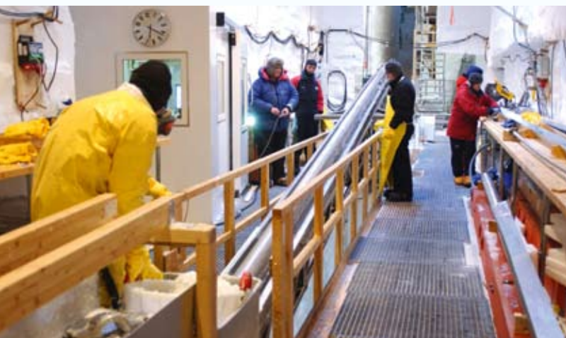
En iskerne på vej op fra dybet.