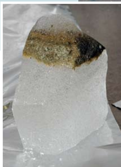
Prøve af jord og is fra Taylor Gletscheren, Antarktis.

Skov i dagens Sydgrønland. Kunne være et snapshot fra Nordgrønland for 130.000 år siden.