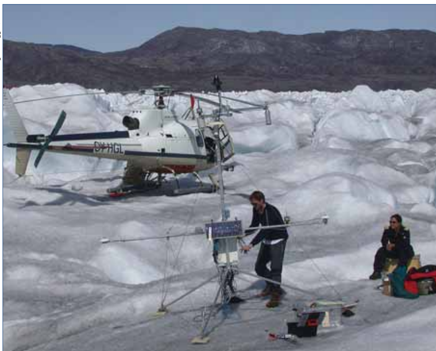
De fuldautomatiske målestationer er udviklet, så de kan klemmes ind i de små helikoptere, der bruges under opsætningen på Indlandsisen

I 2004 har den amerikanske rumfartsorganisation NASA opsendt satellitten ICE-Sat, og i foråret 2005 følger det europæiske European Space Agency efter med Cryosat-satellitten. De to satellitter vil de kommende år holde et vågent øje med den forventede, globale opvarmning på polerne og systematisk måle tykkelsen på havisen og på de store iskalotter på Grønland og Antarktis.